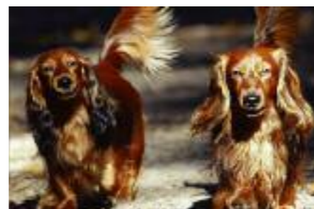
Ein Dackel auf großer Tour

Das Züchten von Dackeln steht im globalen Wettbewerb, neue Trends werden gesetzt und es geht fatalerweise um weit mehr als Gesundheit und Körperbau. Menschen auf der ganzen Welt streben nach dem „perfekten Dackel“.