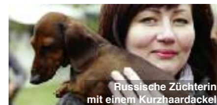
Russische Züchterin mit einem Kurzhaardackel

in den Spiegel, heißt es, sehe er einen Löwen. Der Film „Dackel! Kleiner Hund ganz groß“ erzählt von Geburt und Tod der Dackel, berichtet von den Schwierig-