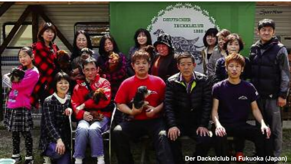
Der Dackelclub in Fukuoka (Japan)

„In Japan gibt es mehr Dackel als in Deutschland“ - diese Zeitungsnotiz brachte das ARTE-Team dazu, Recherchen zu betreiben. Das Ergebnis ist ein Film, der vom weltweiten Dackelboom erzählt. Der kleine Hund mit den kurzen Beinen und dem sehnsüchtigen Blick erobert den Globus.