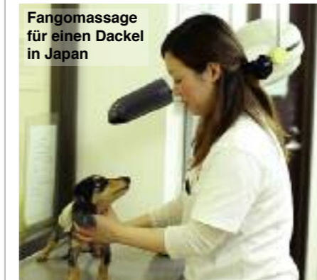
Fangomassage für einen Dackel in Japan

in den Spiegel, heißt es, sehe er einen Löwen. Der Film „Dackel! Kleiner Hund ganz groß“ erzählt von Geburt und Tod der Dackel, berichtet von den Schwierig-