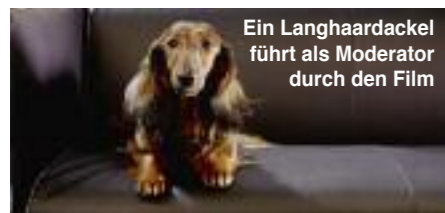
Ein Langhaardackel führt als Moderator durch den Film

Ein Film von Kai Christiansen 10. Februar um 21.45 Uhr auf ARTE